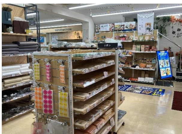
ストア・エクスプレス東京本店 リニューアル後内観

当社は、約50年にわたって培ったモノづくりのノウハウと国内外の生産背景を活かし、今後も、店舗をはじめとするあらゆる空間づくりのパートナーとなるべく、お客様の課題解決に共に取り組んでまいります。