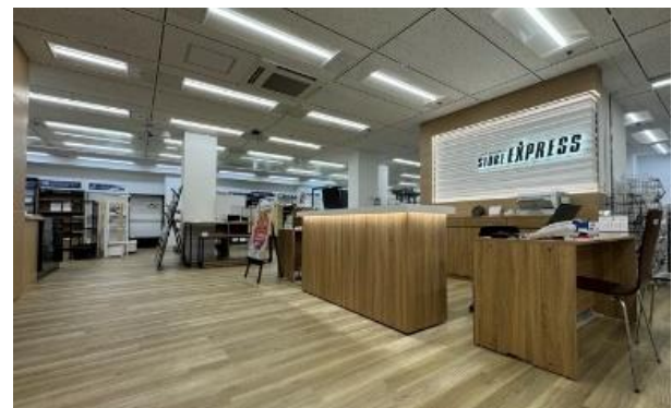
大阪本店 3F 相談カウンター