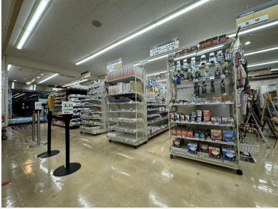
<リニューアル前 1F フロア>

1F フロアの物販エリアにおける全ての什器を当社オリジナルの主力商品に刷新し、使用イメージをご覧いただける構成としました。2F フロアでは、オリジナル什器の大きさや質感などをじっくり確認いただけるサンプル展示を拡充し、また、出店・改装時など店舗づくりのご相談に対応する相談カウンターを併設しています。