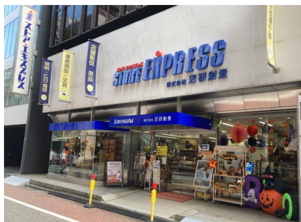
ストア・エクスプレス東京本店 外観